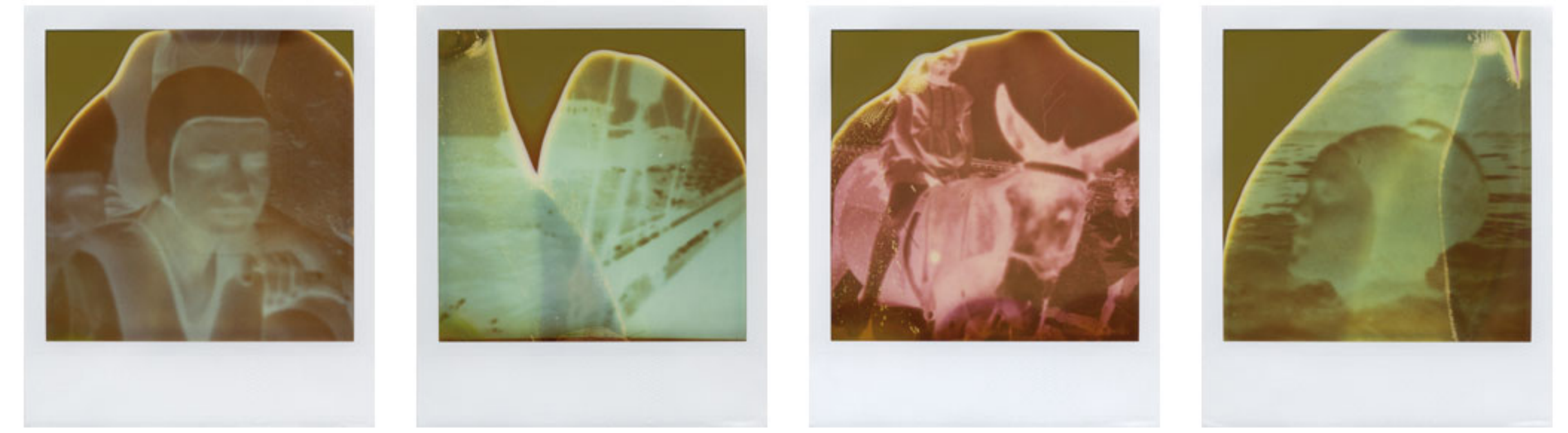
Tag am Meer, 2009/2013 Inkjet-Print, je 60x50 cm

Zwischen Phänomen und Begriff intermedialer Bezüge – Künstlerische Forschung in medienreflexiven Kontexten am Beispiel der SofortBildFotografie und ausgewählter Bezugsmedien.